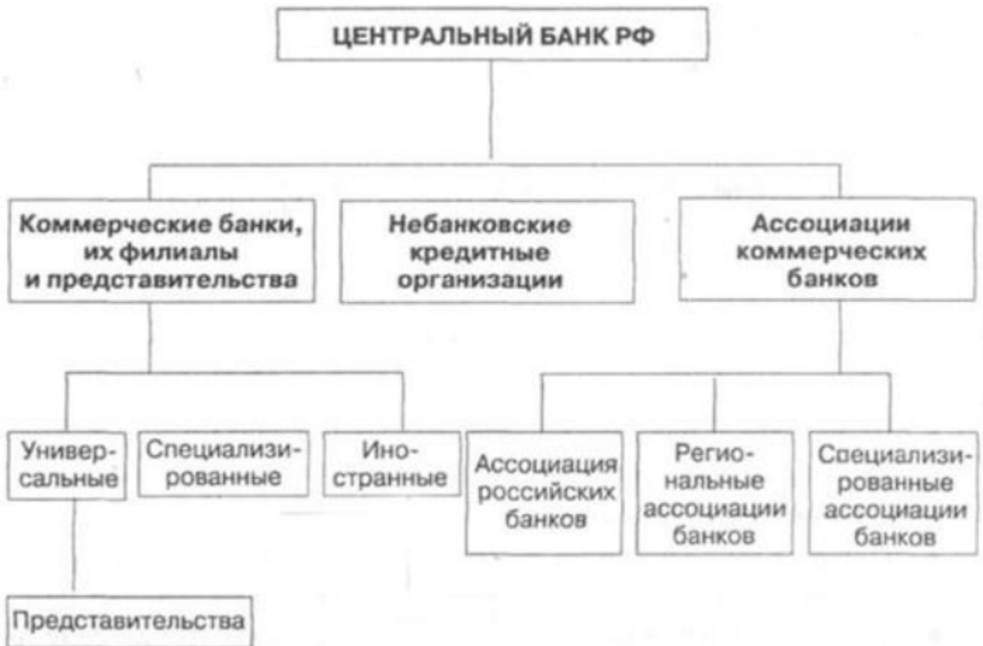
Рисунок 1 - Структура банковской системы в Российской Федерации

Двухуровневая банковская система отражает сложившуюся практику распределения функций и объема полномочий между ее различными уровнями.