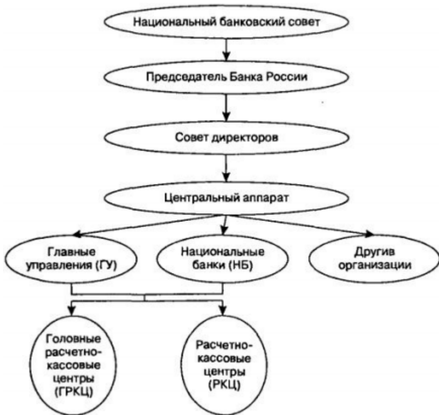
Рисунок 2. Структура России [46]

Высший власти Банка – Совет директоров, наиболее значимые, отражающие его ориентацию. В Совета директоров Председатель Банка и 12 членов, работают на основе в России. Члены директоров назначаются Думой на сроком на года по Председателя Банка, согласованному с Российской Федерации.