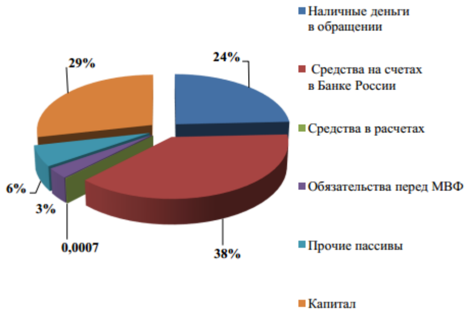
Рисунок 4. Анализ структуры пассивных операций Банка России за 2016 год

Снижение , оттока капитала положительного сальдо торговли – такова платежного баланса за 2016 год, Банком России.